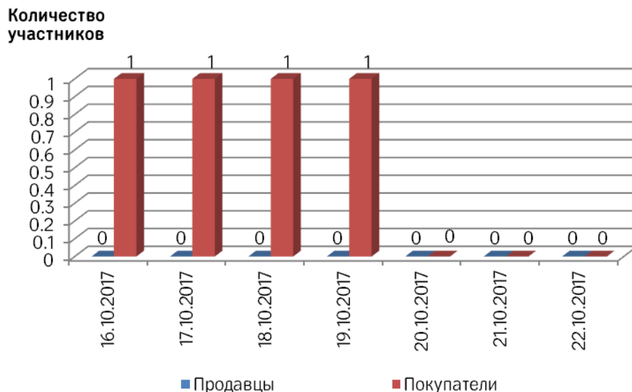
Рис. 1 Соотношение количества участвовавших на торгах продавцов и покупателей за неделю