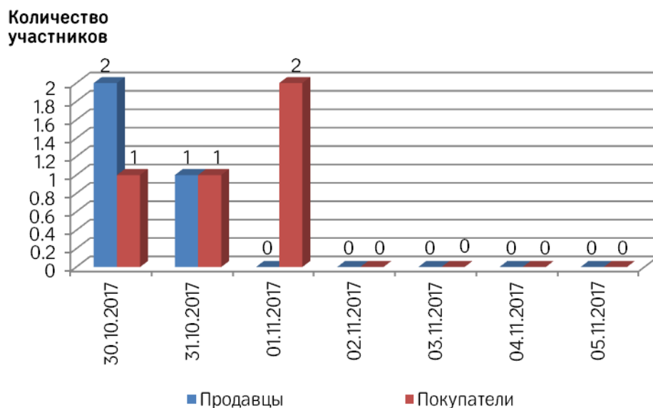
Рис. 1 Соотношение количества участвовавших на торгах продавцов и покупателей за неделю