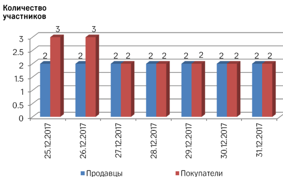
Рис. 1 Соотношение количества участвовавших на торгах продавцов и покупателей за неделю